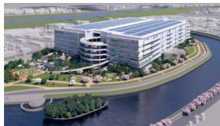
MFLP·LOGIFRONT 東京板橋 板橋ドローンフィールド※