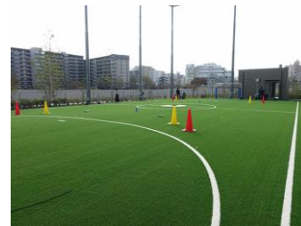
講習用 ネットフィールド

KDDIスマートドローンアカデミー 東京板橋校 〒174-0041 東京都板橋区舟渡4丁目3-1 MFLP·LOGIFRONT東京板橋